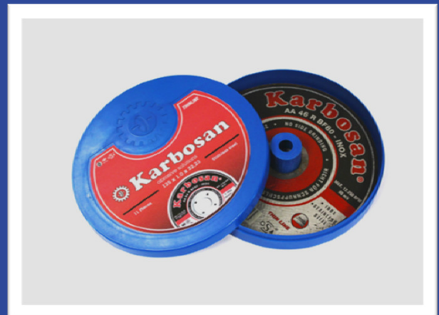
AA 54 R BF80 in den Maßen 115x1,0x22 und 125x1,0x22 Ausführung: gerade

Die Dose schützt die 1 mm dünnen Trennscheiben und bietet professionellen Anwendern einen echten Mehrwert.